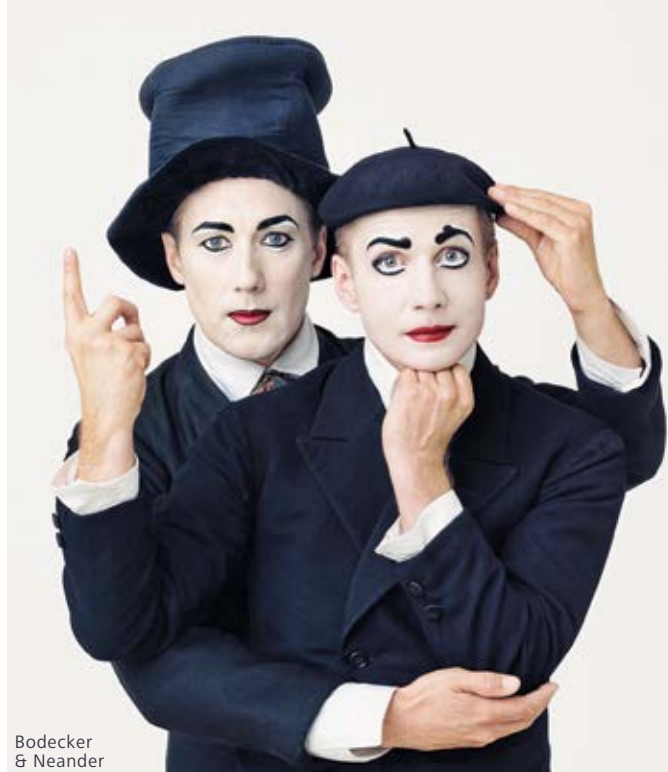
Bodecker & Neander

Führung € 3 (zzgl. VVK/AK Gebühr) Karten Konzert: 40 € / 30 € (zzgl. VVK/AK Gebühr)